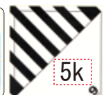
▲ ドライアイス重さ記載シール