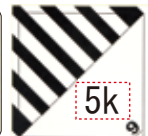
▲ ドライアイス重さ記載シール