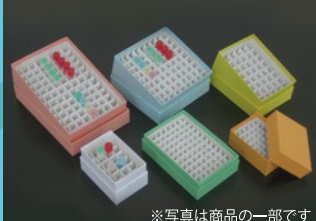
※写真は商品の一部です