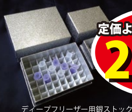
デュープリーザー用銀ストック